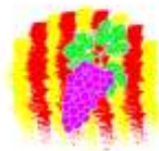
CLUB D'ATLETISME BELLVÍS