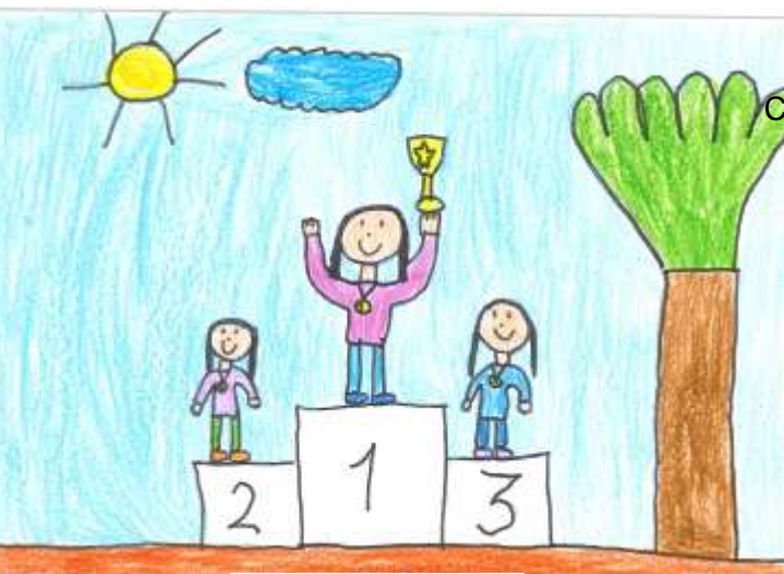
Aldara Gutiérrez López– 2n

A més dels trofeus als tres primers classificats també medalles del 4rt al 6é classificat a les categories de Pre-Benjamí a Aleví. Medalles a totes els participants en les categories Ed.Infantil i Llar Infants